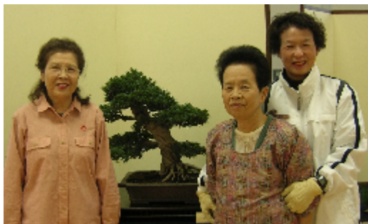
岩村ふれあいセンター多目的ホール 11月12日(土)~13日(日)開催

しないです。楽しみめる雰囲気だ と思えます。毎回24レーン ほどレーンを使用していま すが、見渡す限り岩村の人 で見事ですよ。 盆栽展・水石展に感動! 爽やかな秋風の中、盆栽 展に向かいました。個々の 作品の置き方にも細やかな 心配りがなされた会場で、 一つ一つの説明を受けなが ら見せて頂くと、出展者の 皆さんの努力、熱意、愛情 の凄さが伝わってきて感動 を覚えました。 小さな小さな作品にも何 十年も丹精込めたことが良