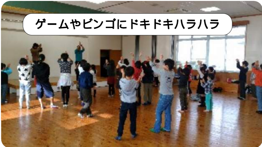
ゲームやビンゴにドキドキハラハラ